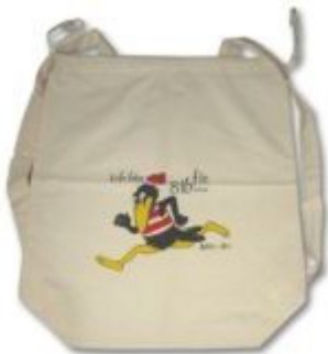
Kinderrucksack aus Baumwolle