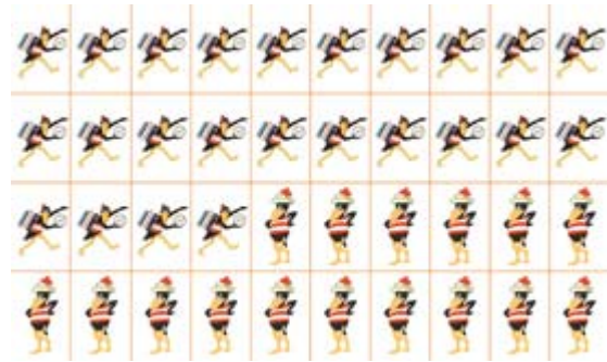
Aufkleber für die Laufkarte