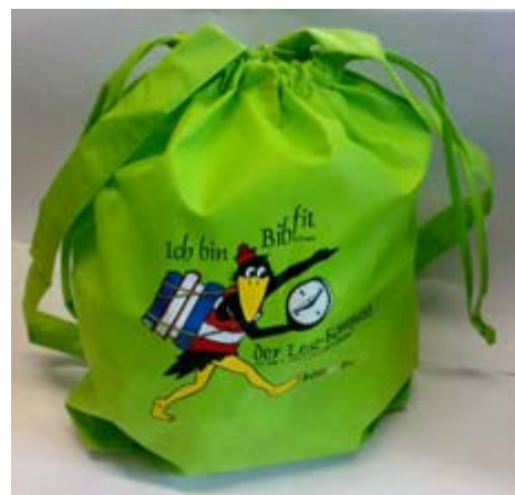
Rucksack mit Aktionslogo