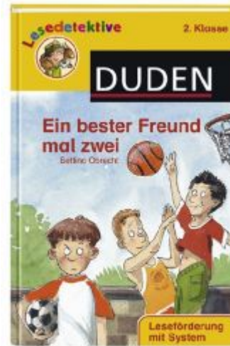
Buch "Ein bester Freund mal zwei" Dudenverlag